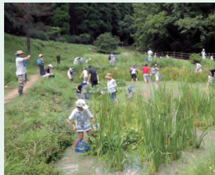
ビオトープ観察会

なお、このビオトープを含む谷あいの里山環境は、2004年から「姫路市立伊勢自然の里・環境学習センター」となり、姫路市が管理しています。