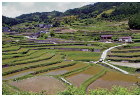
タガメがすむ棚田