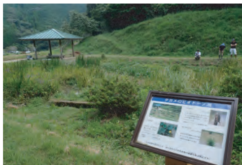
タガメビオトープ